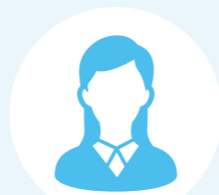
ピア・サポーターM

様々な人との出会いの中で、世界の広がりや自分が支えられている事に気づかされます。いろいろな思いを越えて「自分を大切にしたい」と思えるようになりました。こう思えたのは、ピア・サポートが私に次の一歩と前向きな気持ちを持たせてくれたからだと思います。改めて、ピア・サポーターとの出会いに感謝の気持ちを伝えるとともに、これからの自分を楽しみにしていきます。