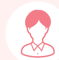
ピア・サポーター K

グループ・ワークは、参加メンバーの様々な意見を聞くことができ 良いですね。自分の意見を言うことに、はじめは戸惑いもありましたが、 ファシリテーターの方の声かけのおかげで、気がついたら楽しく話して いました。