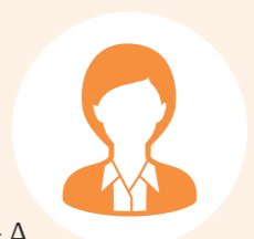
ピア・サポーターA

傾聴は日常の人間関係の中で、日々実践しています。難しさを痛感していますが、目の前にいる人を大切にすることにつながるので、身につけたい重要な能力です。今後も私はこのサポートを続けていきたいと思っています。