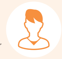
ピア・サポーター！

患者会を設立して交流会を開催する度に、もっと上手に進行できないのか？悩み事にもっと寄り添えないのか？と悩んでいましたので、研修の募集を今か今かと待ちわびていました。基礎研修で、難病に関する知識や社会保障について学びました。私も誰に聞いて良いのか、迷った事があるので、同じ立場で難病の方々に相談できる場所があると知り、心強く思いました。