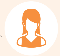
ピア・サポーター Y

でも実際は、ピア・サポートすることで自分自身が活かされているのだとも感じています。ピア・サポートできることに心より感謝です。こんな私に話してくれた方に本当に感謝しています。