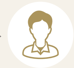
ピア・サポーターI

研修中に新しい仲間が出来たことは私の心の癒しであり、病いは違っても、視野が広がり、何よりも気持ちが豊かになりました。