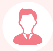
ピア・サポーター K

自分自身をサポートすることでしょうか。自分もサポートされることで、よりピア・サポーターとしても生きてくるのではないかと思います。病気の専門家でもなく資格があるわけでもないけれど、同じ病いをもっている分共感を呼び心情を汲み取りやすい。病いをもっていないと分からないことがあると思います。世の中には同じ考えや同じ価値観を持った人は一人もいないと言いますが、共通する部分は意外とたくさんあると思います。