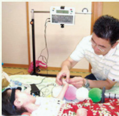
入力用スイッチの調整をしている様子