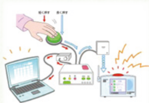
「重度障害者用意思伝達装置」 導入ガイドライン2012 日本リハビリテーション工学協会 より